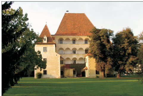
Schloß Alt-Kainach in Bärnbach

Alle Tätigkeiten sind selbstverständlich ehrenamtlich.